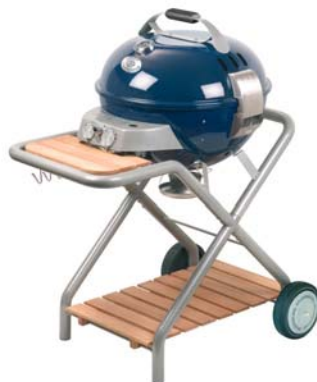
Grill & Pfannen